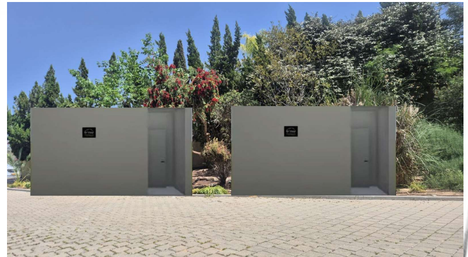
הצבה מימין לקרוסלה