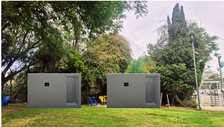
הצבה משמאל לקרוסלה

מבנים יבילים (מאושרים ע"י פק"ע) מענה מיגון לכ-60 איש ללא שימוש בשגרה. עלות מוערכת - כ-600 א"ש ללא בצ"מ לו"ז - כחודש.